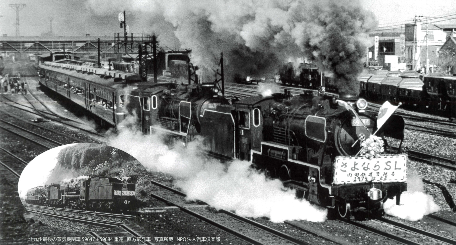
北九州最後の蒸気機関車 59647+59684 重連 直方駅発車