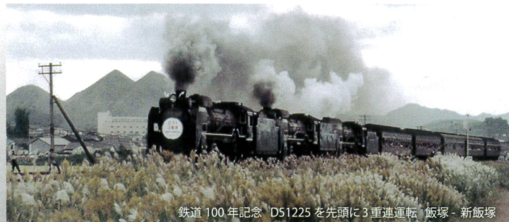
鉄道100年記念 D51225を先頭に3重連運転 飯塚 - 新飯塚