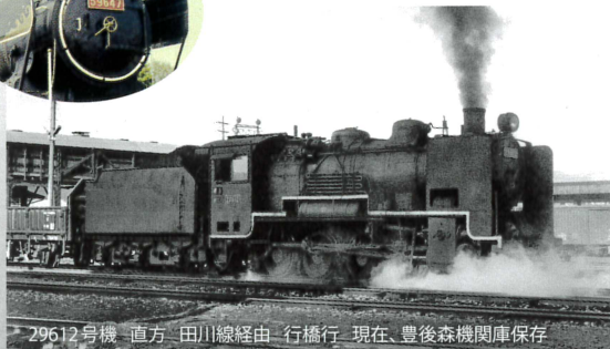
29612号機 直方 田川線經由 行橋行 現在、豊後森機関庫保存