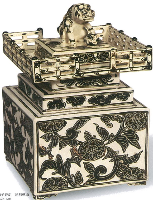
鍍絵獅子香炉 尾形乾山 江戸時代中期