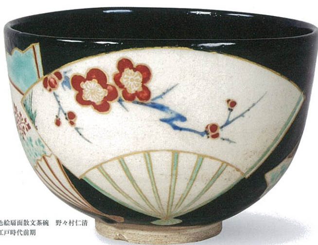
色絵扇面散文茶碗 野々村仁清 江戸時代前期