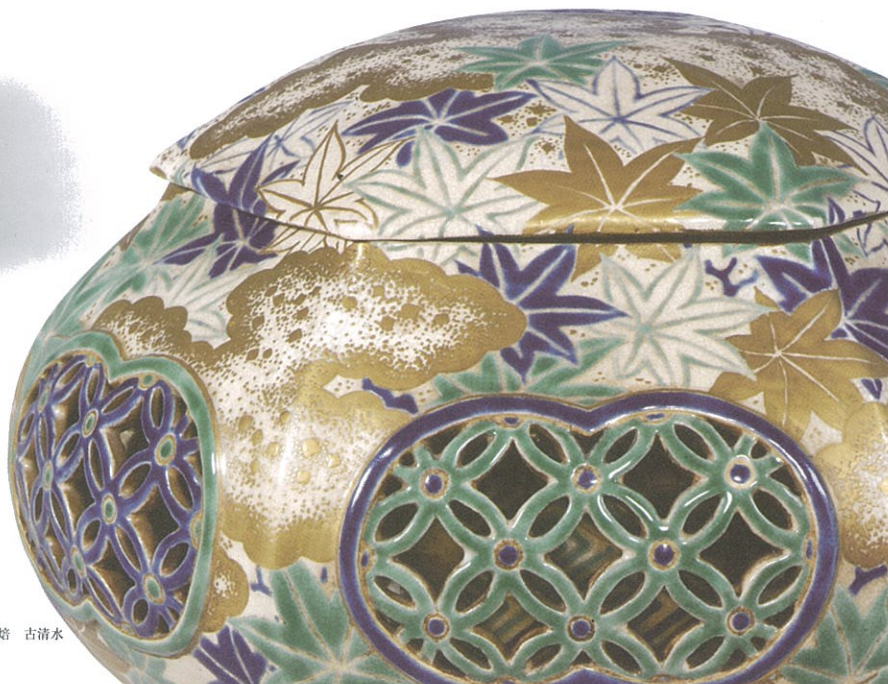
色絵楓文透彫手焙 古清水 江戸時代中期