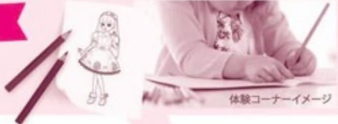
体験コーナーイメージ