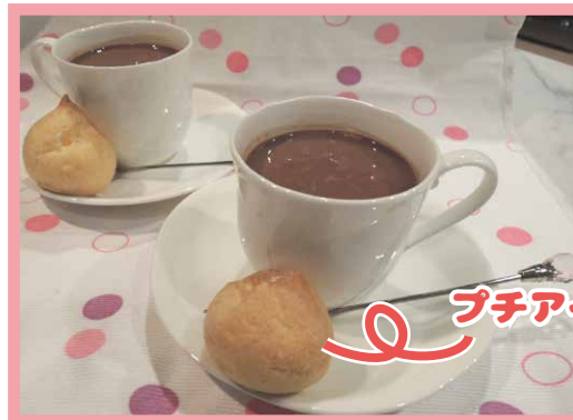
プチアイスシュー