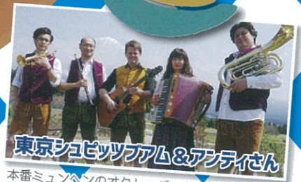
東京ジュビッツァム&アンティせん

主催 九州オクトーバーフェスト in 門司港 実行委員会 後援 北九州市、ドイツ観光局、大阪・神戸ドイツ連邦共和国総領事館、バイエルン州駐日代表部、門司港レトロ倶楽部、テレビ西日本、RKB毎日放送、九州朝日放送、TVQ九州放送、西日本新聞社、読売新聞西部本社、朝日新聞社、全国地ビール醸造者協議会、九州クラフトビール協会 協賛 株式会社スターフライヤー 協力 北九州市にぎわいづくり懇話会 料金 チケット制/10枚つづり1,000円 情報 https://www.facebook.com/KyushuOkfes/