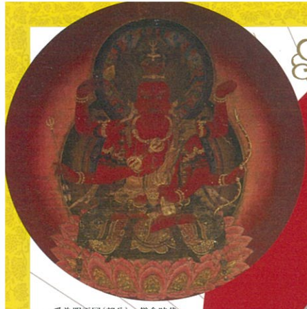
愛染明王図(部分) 鎌倉時代