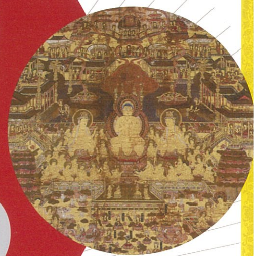
当麻曼荼羅図(部分) 鎌倉時代末期～南北朝時代