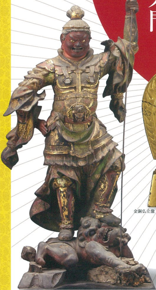
增長天像 鎌倉時代