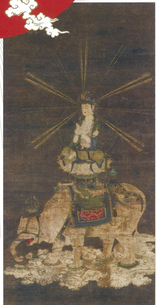
菩提菩薩騎象図 鎌倉時代