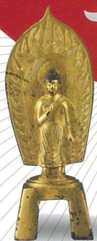
金銅仏立像 中国 北魏・太和8年(484)銘