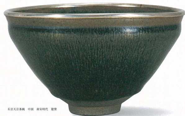
禾目天目茶碗 中国 南宋時代 建窯