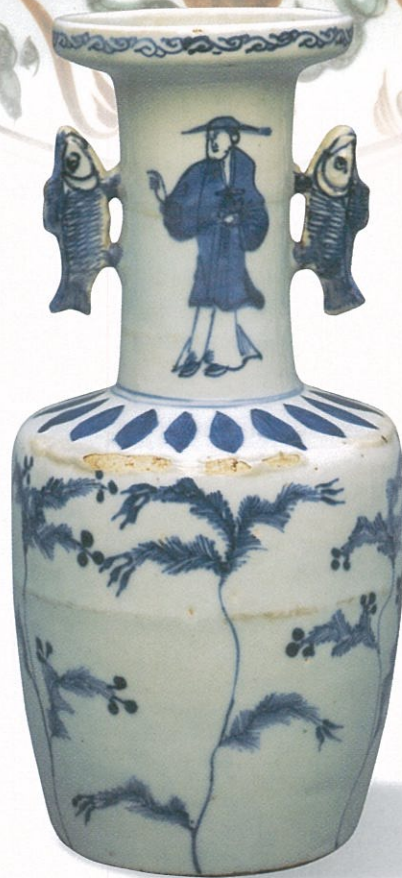
古紫竹高砂花生 中国 明時代末期 景德鎮窯