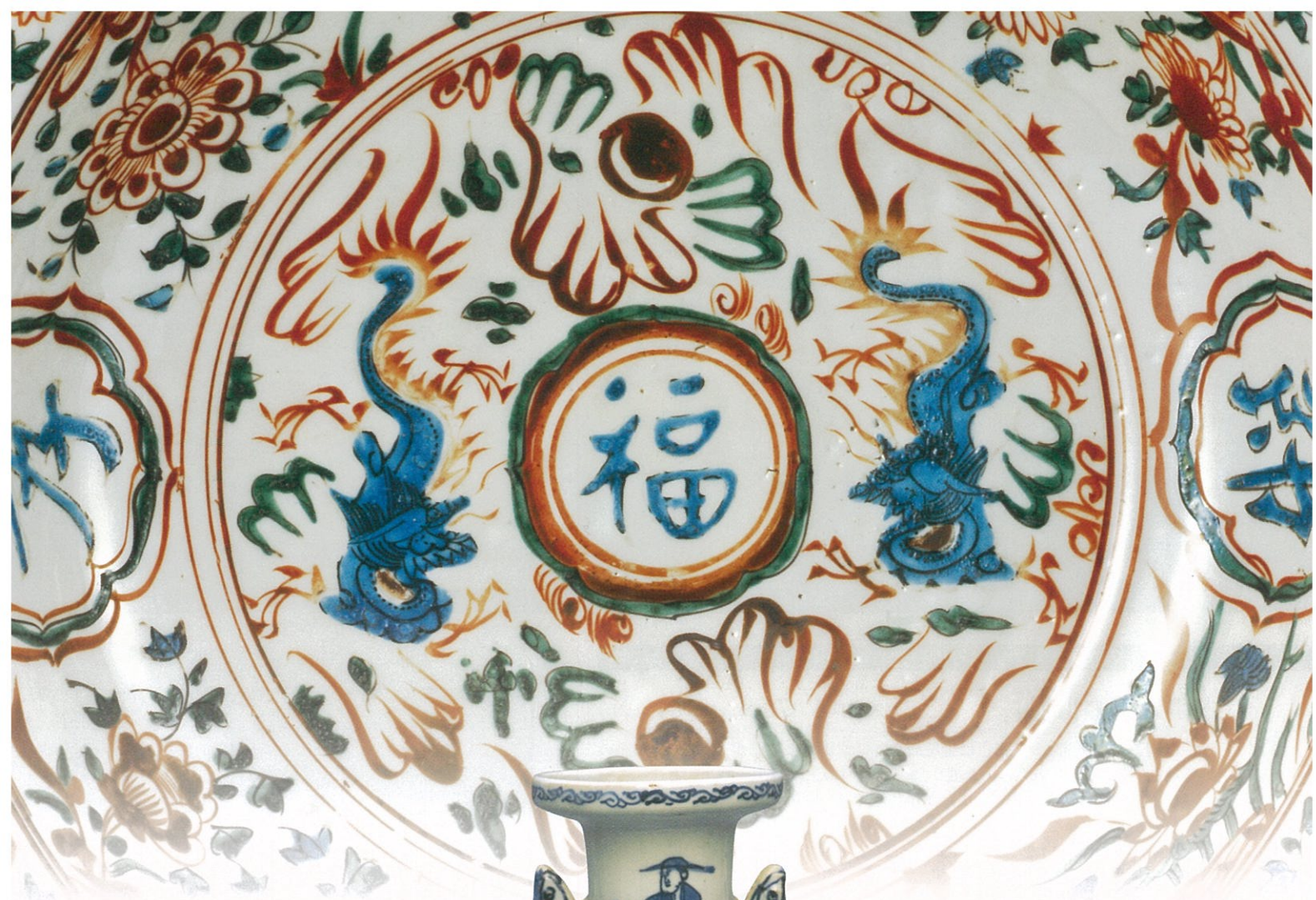
杭州赤松双鹿文字文皿(部分) 中国 明時代末期 漳州窯