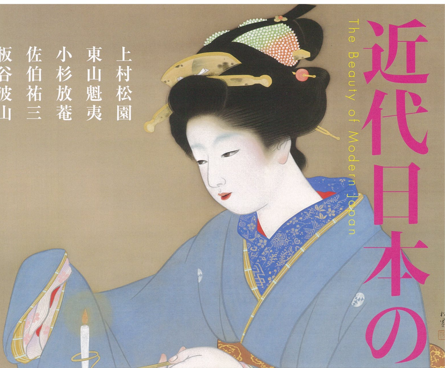
灯(部分) 上村松園 昭和12年