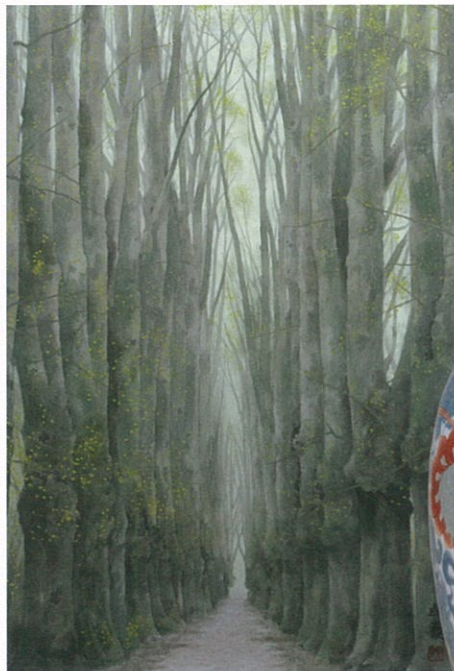
春梢 東山魁夷 昭和58年