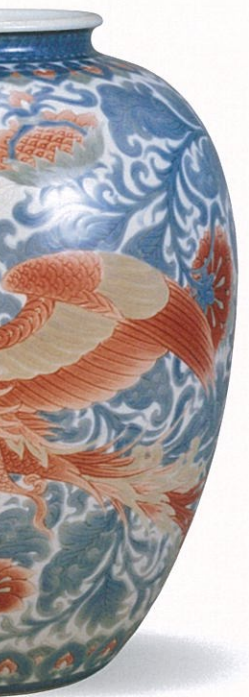
彩磁瑠璃花鳳凰紋様花瓶 板谷波山 大正12年