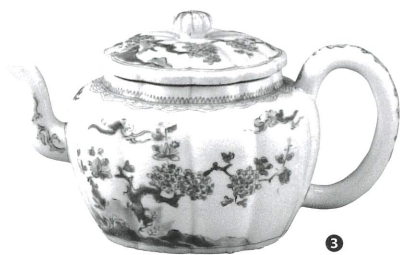
① 色絵花籠手花卉文皿 古伊万里 江戸時代中期 ② 青磁染付宝尽文大皿 鍋島 江戸時代中期 ③ 色絵梅樹文水注 柿右衛門 江戸時代前期