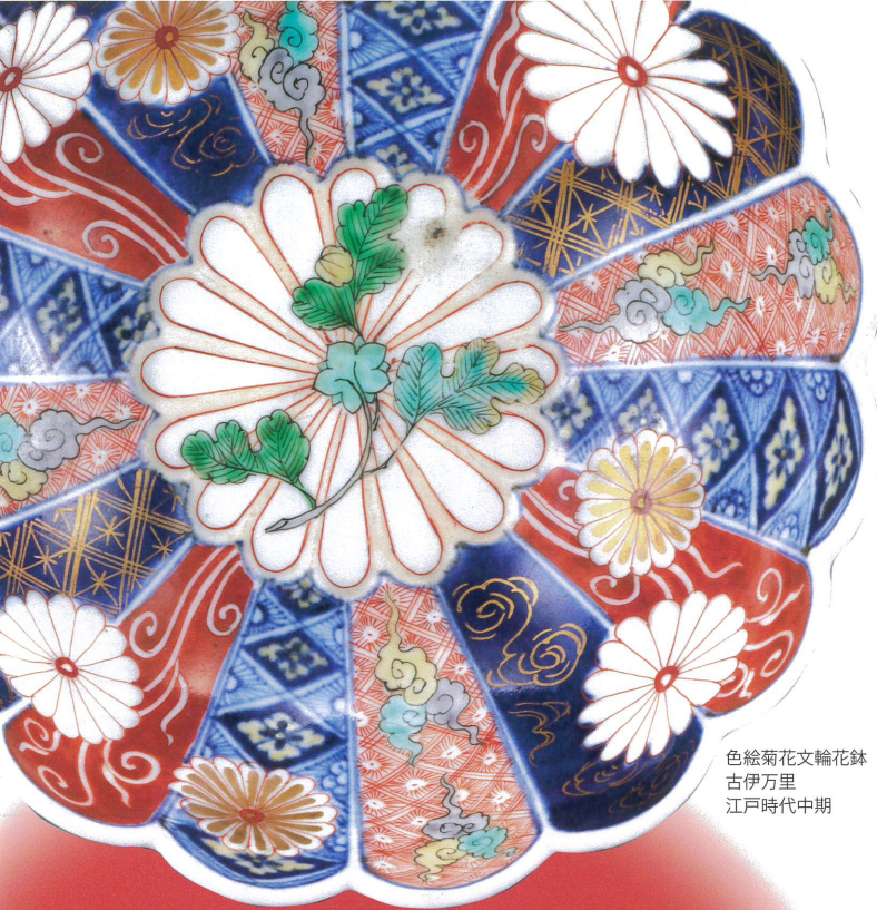
色絵菊花文輪花鉢 古伊万里 江戸時代中期