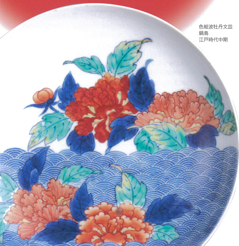
色絵波牡丹文皿 鍋島 江戸時代中期