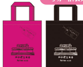
定番オリジナルエコバッグ