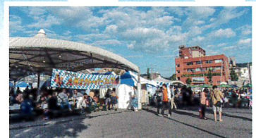
東京シュピッツアム&アンディさん