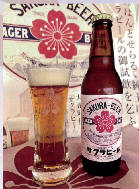
サクラビール ラベル

大正時代に使用されていた本物のラベルを中央に使用 ビール工場全景と行き交う船で賑わう関門海峡が描かれています 当時の様子が見えるラベルとしてビール産業史でも紹介されています