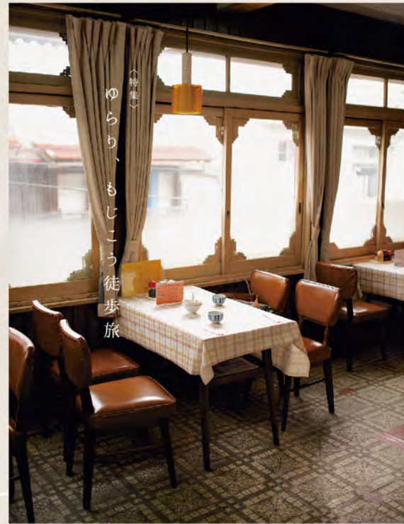
〈特集〉 ゆらり、もじこう徒歩旅

創刊号は観光地ではなく、普段の門司港の日常を切り取りたいと、まちを歩きました。坂の上から見える海峡、公園でスケッチする老人、花街の名残が残る古い家屋など、この町ならではの魅力に触れることができました。