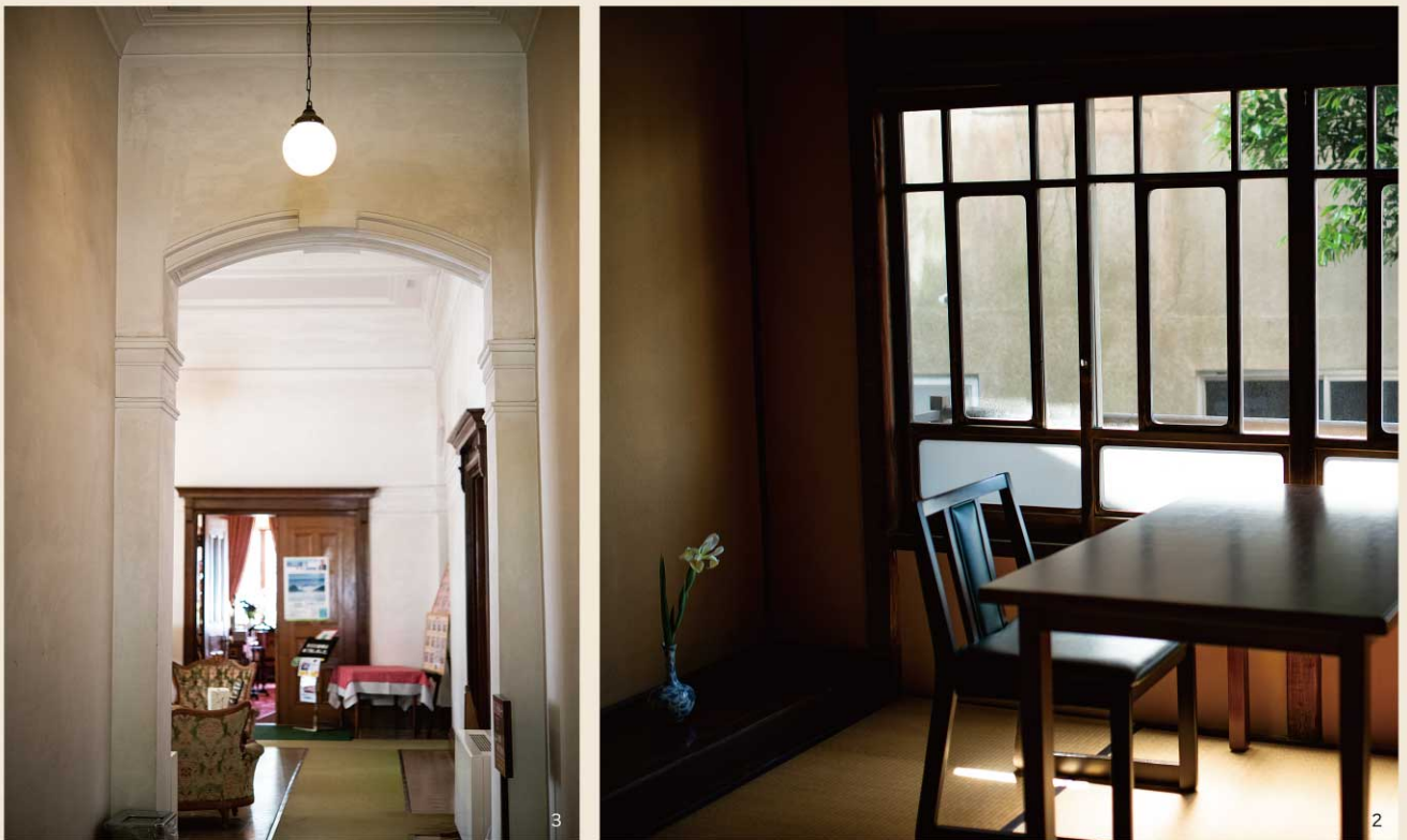
1. 九州鉄道記念館 2. 三宜楼 3. 旧門司三井倶楽部