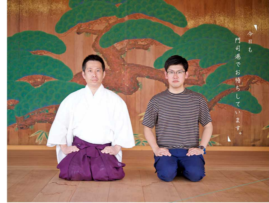
撮影場所 甲宗八幡宮 能舞台

もじこうの 人 vol.3 海峽の港町「門司港」 この地に特別な魅力を感じ、 この地を愛して 止まない人たちがいます。 そんな町の人同士に 出会っていただきました。