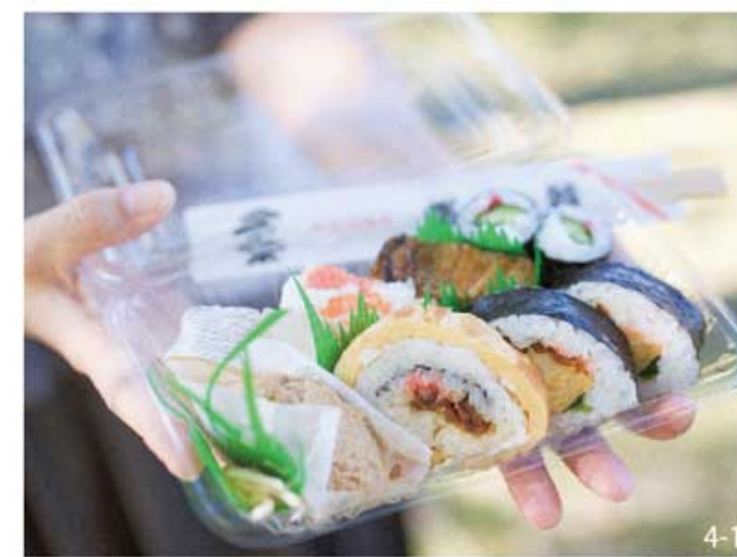
こちらの押し寿司スキ! / 松之館