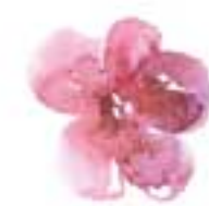
桜の下はベビーピンクなめかり色 / めかり公園