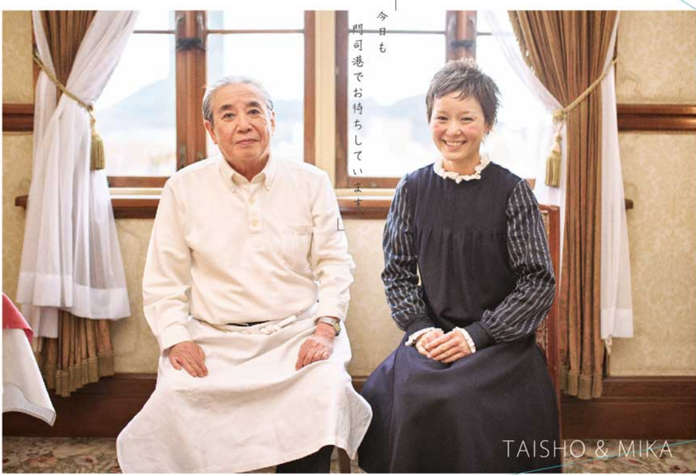
撮影 旧門司三井倶楽部

集合：旧門司三井倶楽部 定員：10名 解散：港ハウス(レトロ地区) 日本画家が描いた門司港風景の線画に、色鉛筆で色を塗っていきます。初心者の方でも大丈夫!色鉛筆画の基礎をプロがわかりやすく解説します。お持ちの方は色鉛筆をご持参ください。お手本の「絵はがき」付きで楽々アート入門!