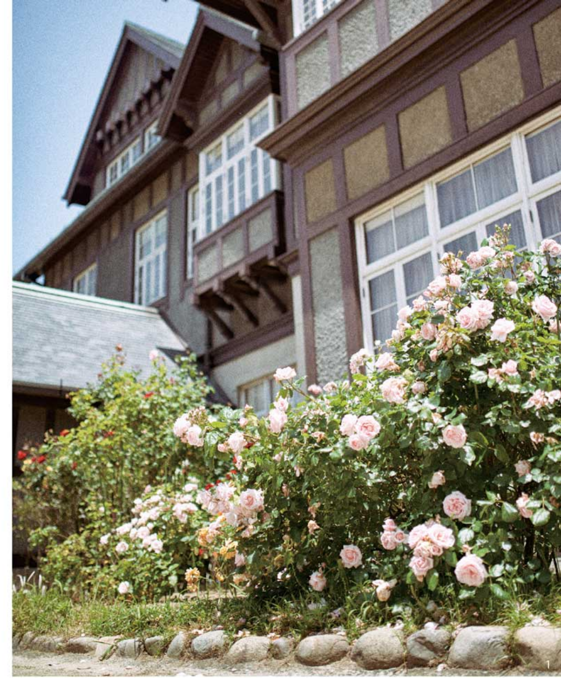
美しいものにはトゲがあるってほんとかな / 旧門司三井倶楽部 ※バラの見頃は5月

●白野江植物公園 門司区白野江2丁目 tel 093-341-8111 営) 9:00-17:00 休) 火曜日、年末年始 料) 一般200円 小・中学生 100円 www.shiranoie.com