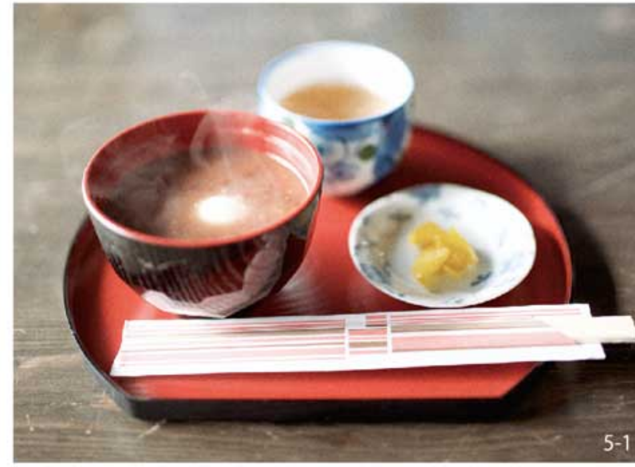
冬はおしるこ、夏は冷やしぜんざいがおすすめ / 白野江植物公園内 御花茶屋