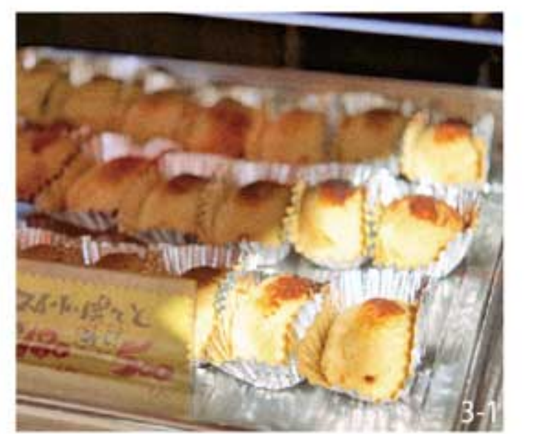
お芋はいつも私の味方 / 芋伝説