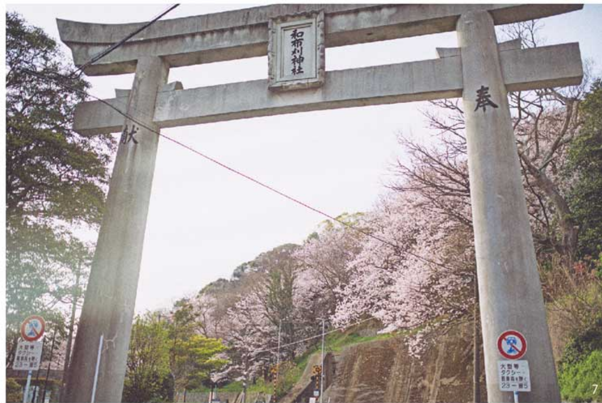
道をまたぐ大きな鳥居がお出迎え / 和布刈神社