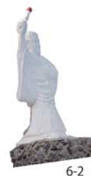
清虚さんは海の難所「部埼周辺」を通る船のため、亡くなるまでの13年間目印となる火を読経と共に焚き続けたそう