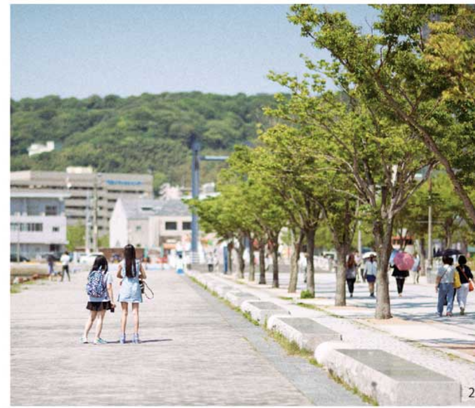
海岸沿いをどこまでも歩いていたい / 西海岸