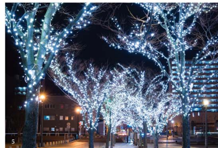
イルミネーション点灯時間 17:30-22:00 (1月1日は午前5時まで) ※詳細は7Pへ