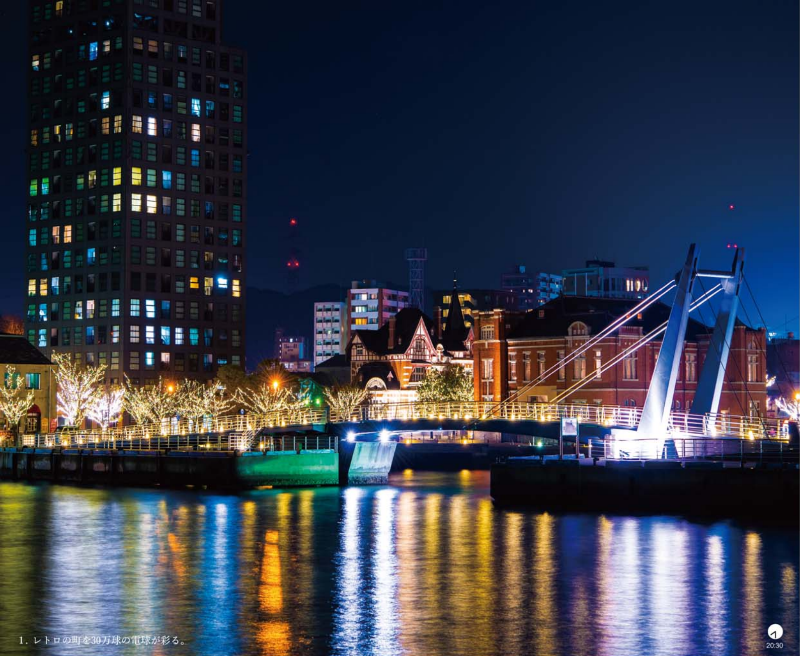
1. レトロの町を30万球の電球が彩る。