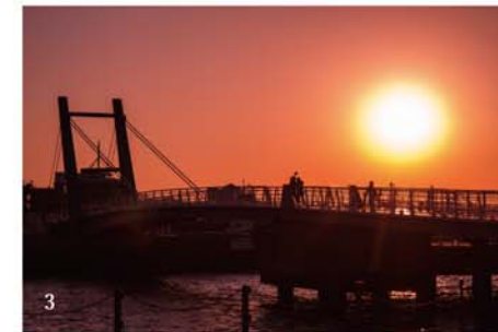
2.3. 跳ね橋「ブルーウィングもじ」と夕日