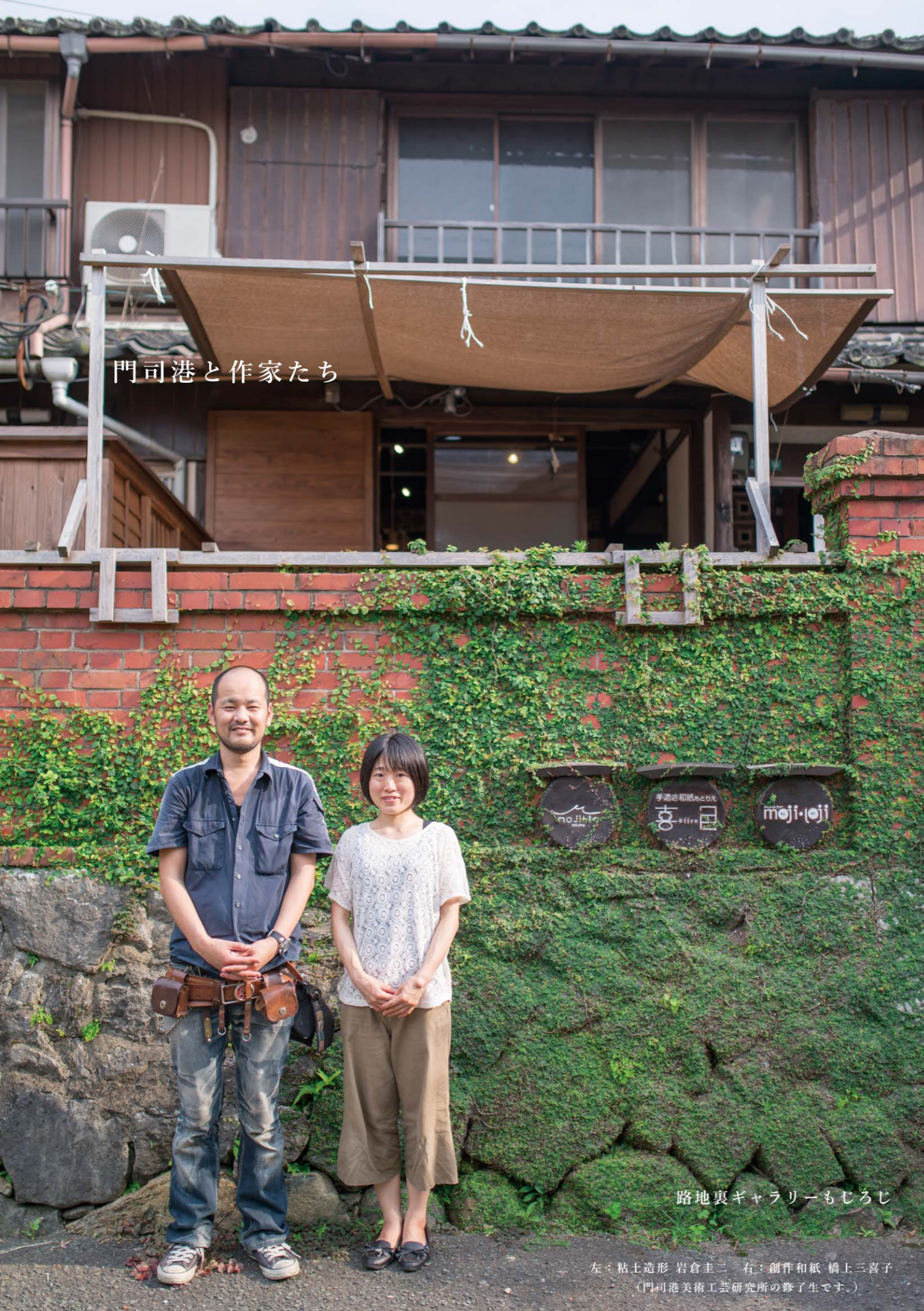
門司港と作家たち