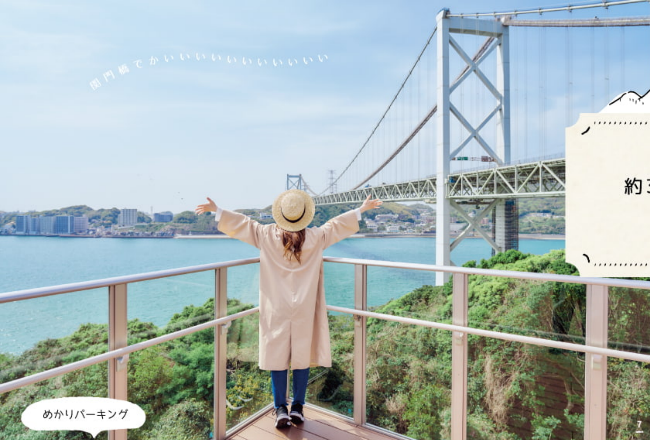
めかりパーキング