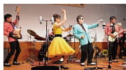
1950年～70年代のポップス (オールディーズ、ロック、Jポップ ほか)

6/18 [日] 場所 旧大連航路上屋 2階ホール 7/16 [日] 場所 関門海峡ミュージアム前広場 時間 11:00 - 16:00 定員 100名 MAMA田中 TEL 080-3377-1191