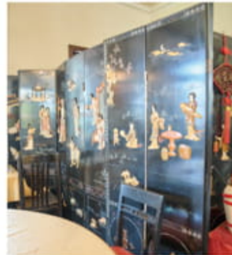
オープン当初、大連から船便で輸送した思い入れのある衝立