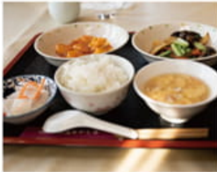
素材の味を生かした海鮮中華が人気

私が好きなのは、故郷の中国の大連ととてもよく似たこの景色です。門司港を初めて訪れた時、大連の空港を旅立ったときと同じ匂いがしたのを今でも覚えています。どちらも同じ港町で、よく似た橋がかかっているんです。あれから24年、地元の方たちがとにかく優しくしてくださって、知り合いも増え、今では第二の故郷だと思っています。友好都市大連市との架け橋になればと、どなたにもいつも門司港を紹介していますよ！