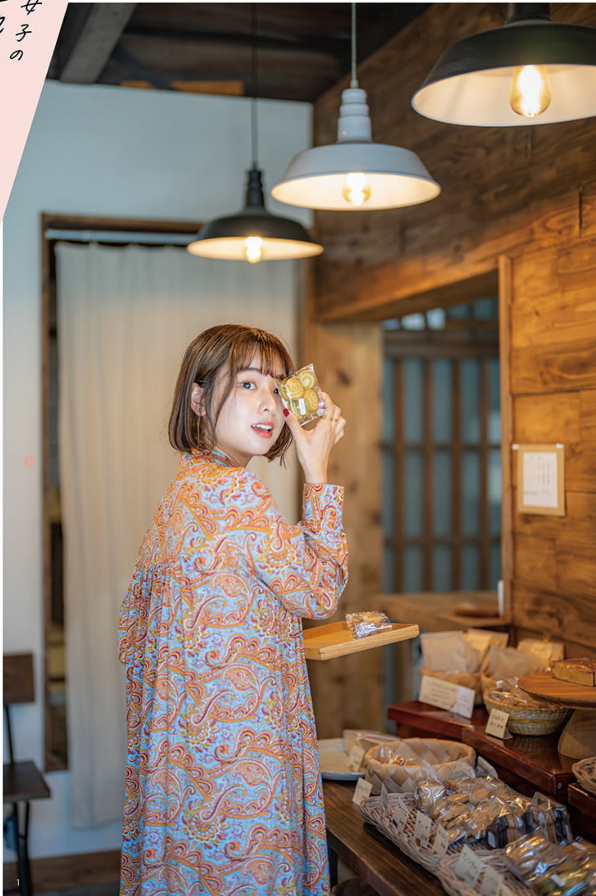
1. お一人で手作りされているおやつ屋さん「GOURD」(門司区錦町6-22/11:30~売り切れ次第終了/不定休)