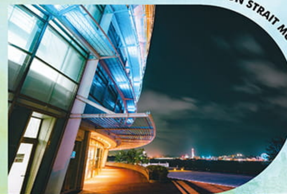
ブルーのライティングがなんか好き