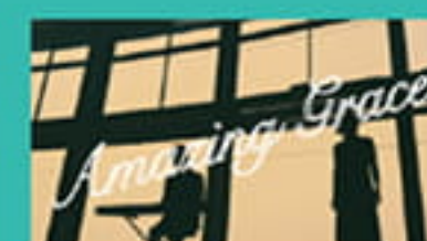
関門海峡ミュージアムver.

大陸航路の玄関口として栄えた門司港。海外から様々な文化が渡り、その中でも当時の流行歌であったジャズは門司港で数多く演奏されてきました。今回、「門司港ハーバーデッキジャズ」として定期的に門司港レトロで演奏を行っているミュージシャンにご協力いただき、門司港レトロの観光スポットにおいてプロモーション映像を作成しました。幻想的な夜景や外国船が行き交う雄大な関門海峡とジャズの音色のコラボレーションをお楽しみいただけますので、ぜひご覧ください!