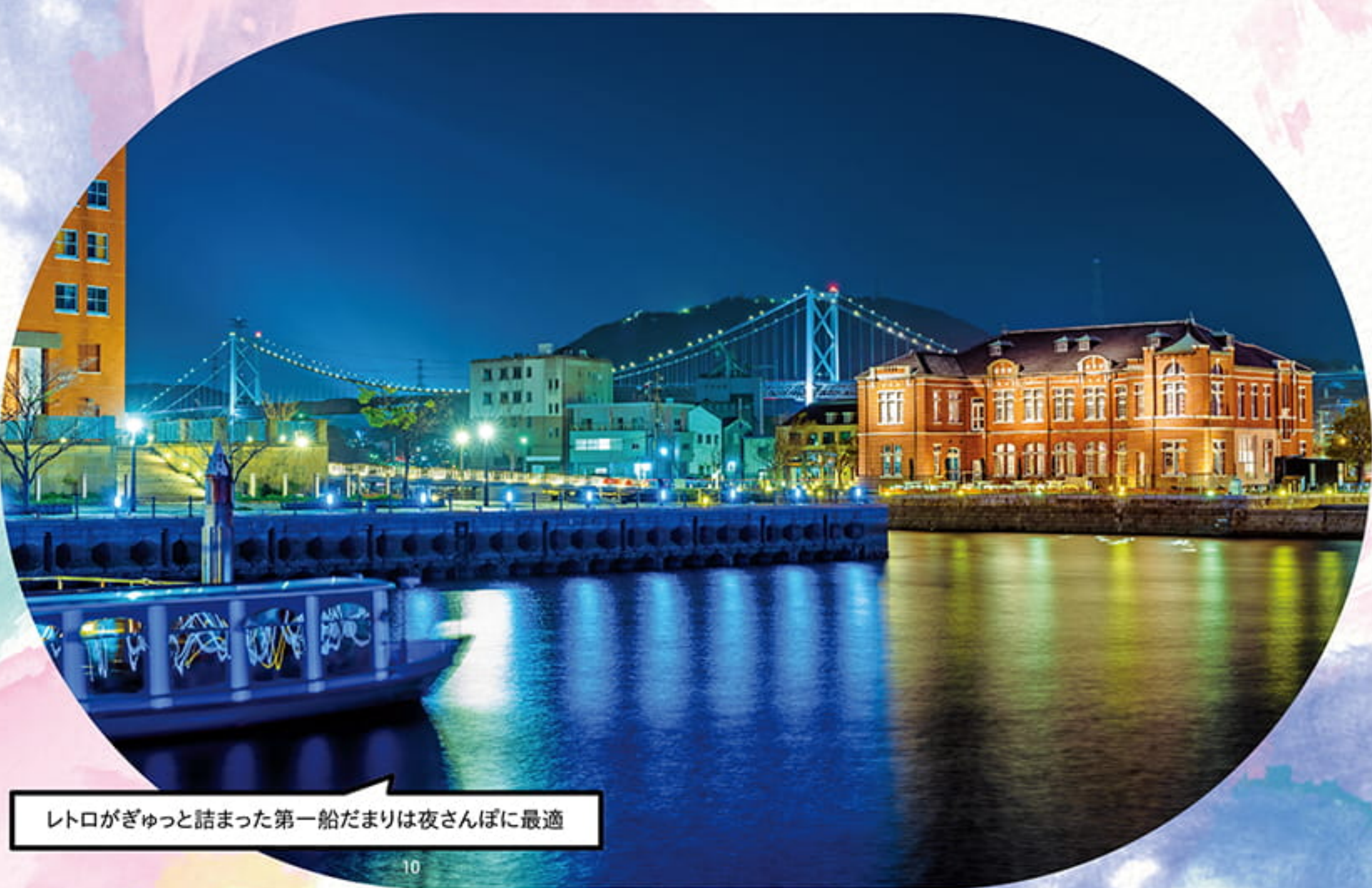
レトロがぎゅっと詰まった第一船だまりは夜さんぽに最適