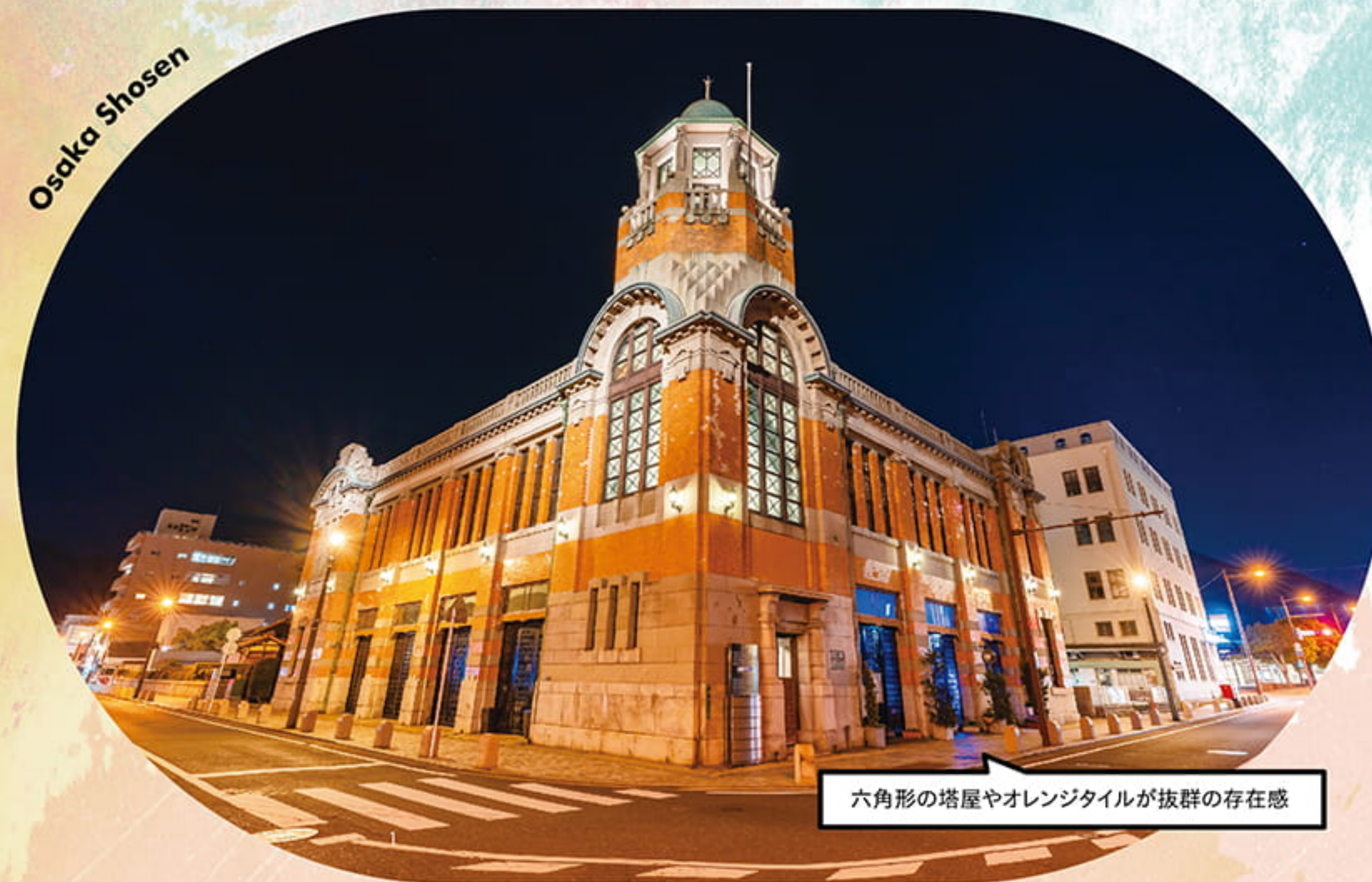
六角形の塔屋やオレンジタイルが抜群の存在感