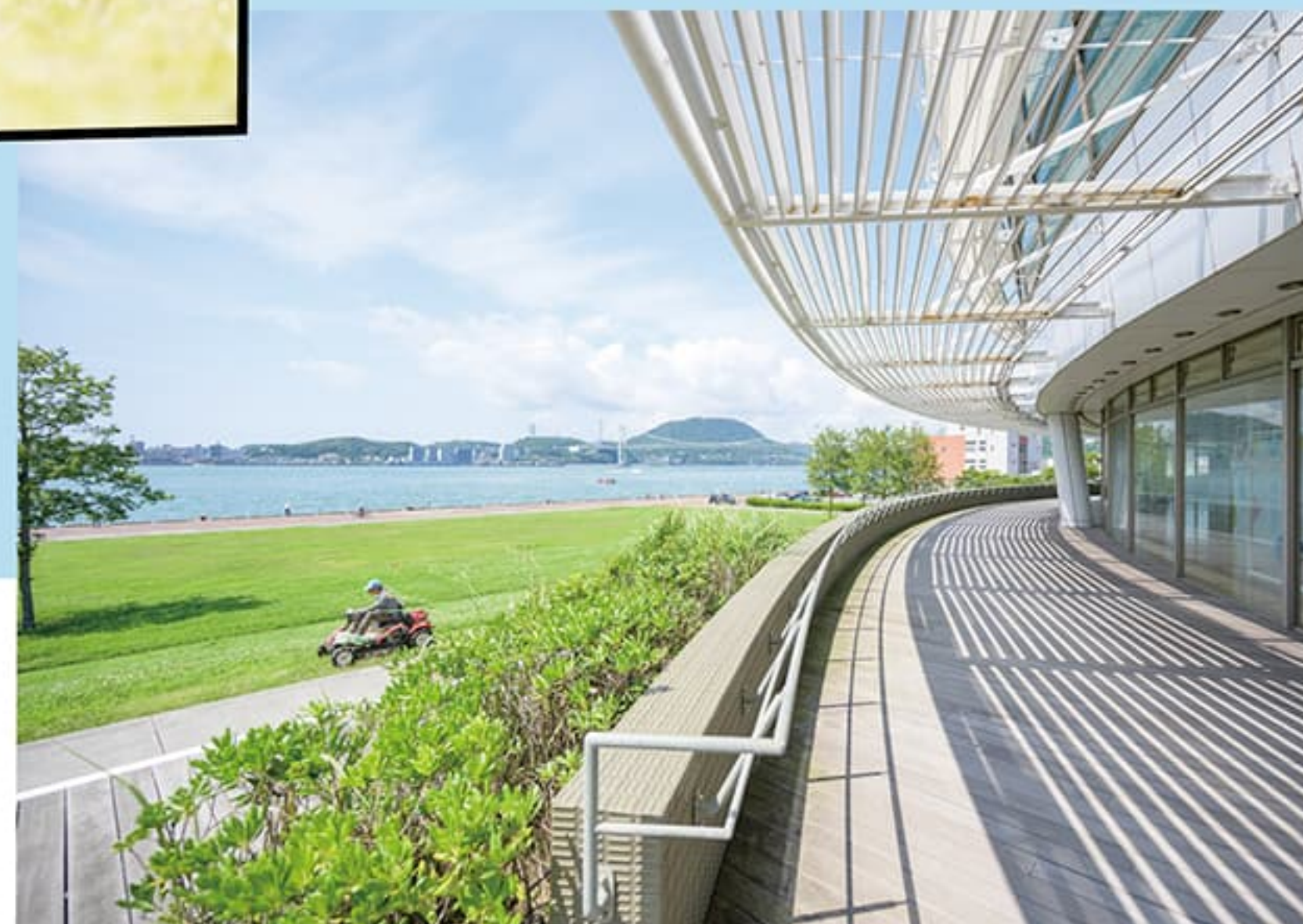
1 関門海峡ミュージアム 門司区西海岸 1-3-3