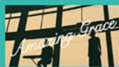
関門海峡ミュージアムver.

大陸航路の玄関口として栄えた門司港。海外から様々な文化が渡り、その中でも当時の流行歌であったジャズは門司港で数多く演奏されてきました。今回、「門司港ハーバーデッキジャズ」として定期的に門司港レトロで演奏を行っているミュージシャンにご協力いただき、門司港レトロの観光スポットにおいてプロモーション映像を作成しました。幻想的な夜景や外国船が行き交う雄大な関門海峡とジャズの音色のコラボレーションをお楽しみいただけますので、ぜひご覧ください!